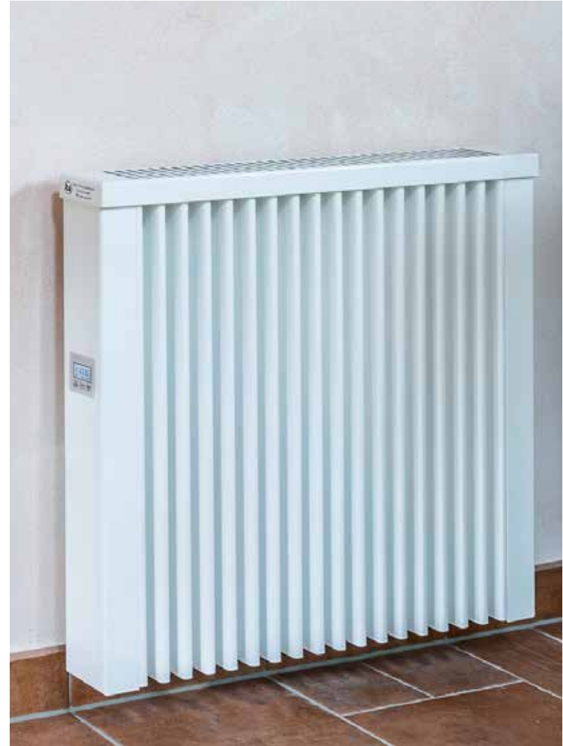
Internetmodul für smart heat